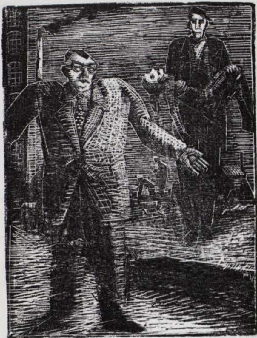
Fra „Passion”, (Indtog i byen), 1949, xylografi. Hel størrelse.