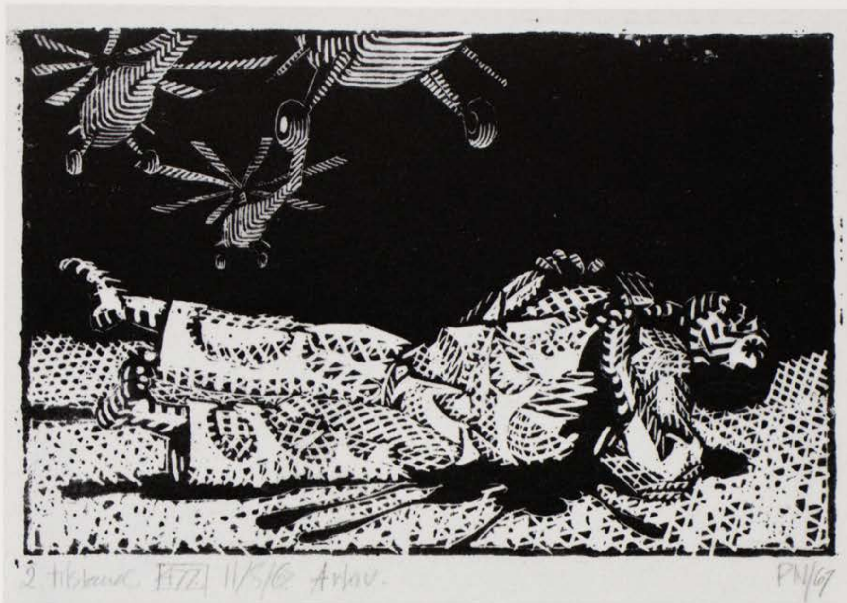
Fra „Ofrene”, (Vietnam), (477), 1967, træsnit. Hel størrelse.

hele menneskealdre. Men verdensånden er en god svømmer, og storme og bølger kan ikke få bugt med ham.