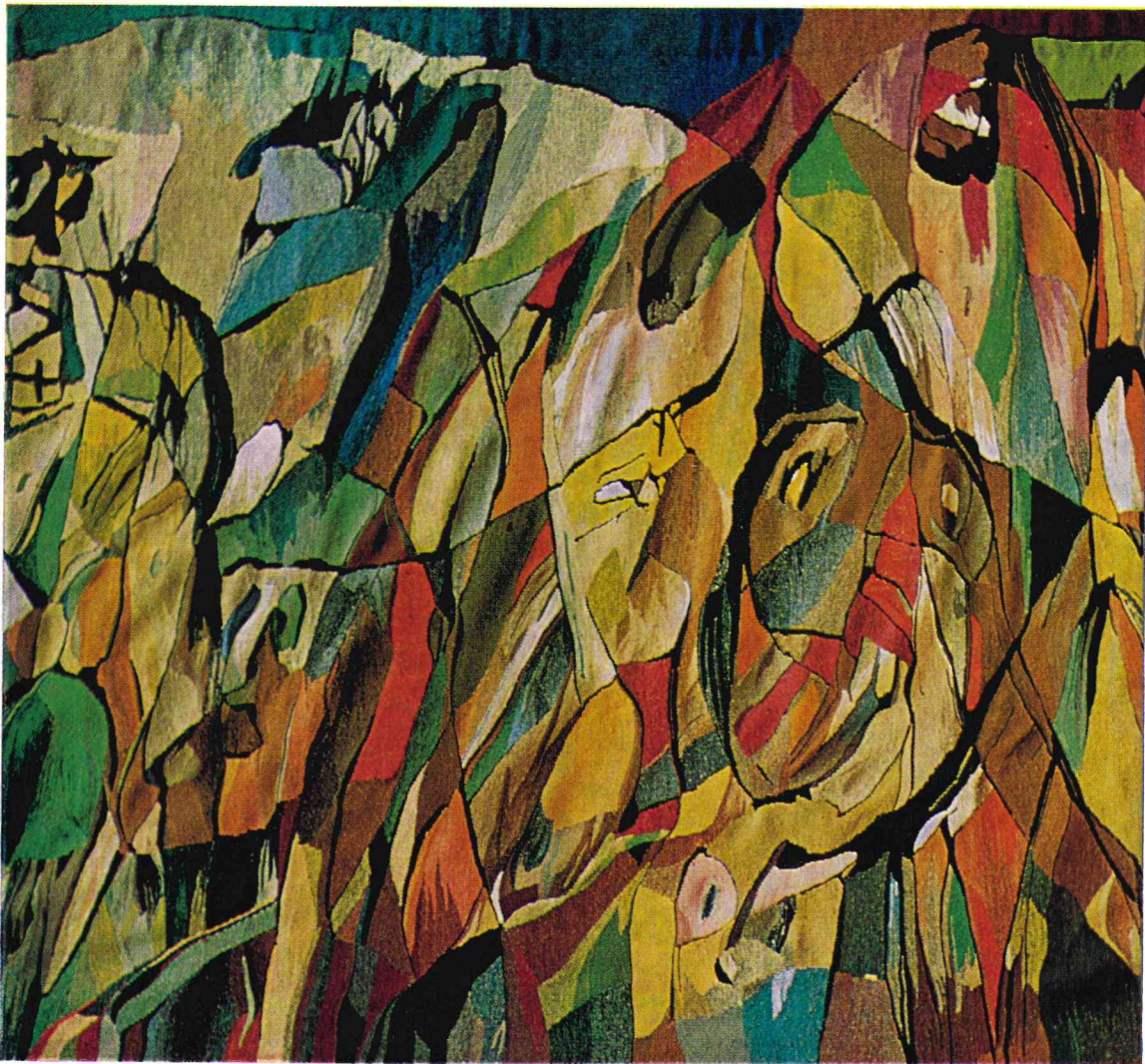
Detalje af det 1,80 × 14 meter lange vægtæppe af Jorn og Wemaëre: „Den lange rejse“.

INDHOLD: MALEREN VILLY DAUGAARD PEDERSEN - GRAFIKEREN PALLE NIELSEN - MALEREN JOHANNES HOLBEK - BOGEN OM ASGER JORN - GAMLE MØBLER FRA SØNDERJYLLAND - KERAMIKUDSTILLING PÅ BORNHOLM - UDSILLINGER - UDSTILLINGSNYT - BOGNYT