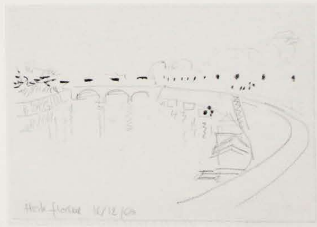
»Romersk notat«, sort blyant. 1960. 10,4×14,7 cm.

At bevæge sig i Rom kan føles som at deltage ud fra det at være proportion, en opretstående, lille figur der forholder sig til de skiftende rum, aktivt skabende eller som passiv rekvirit.