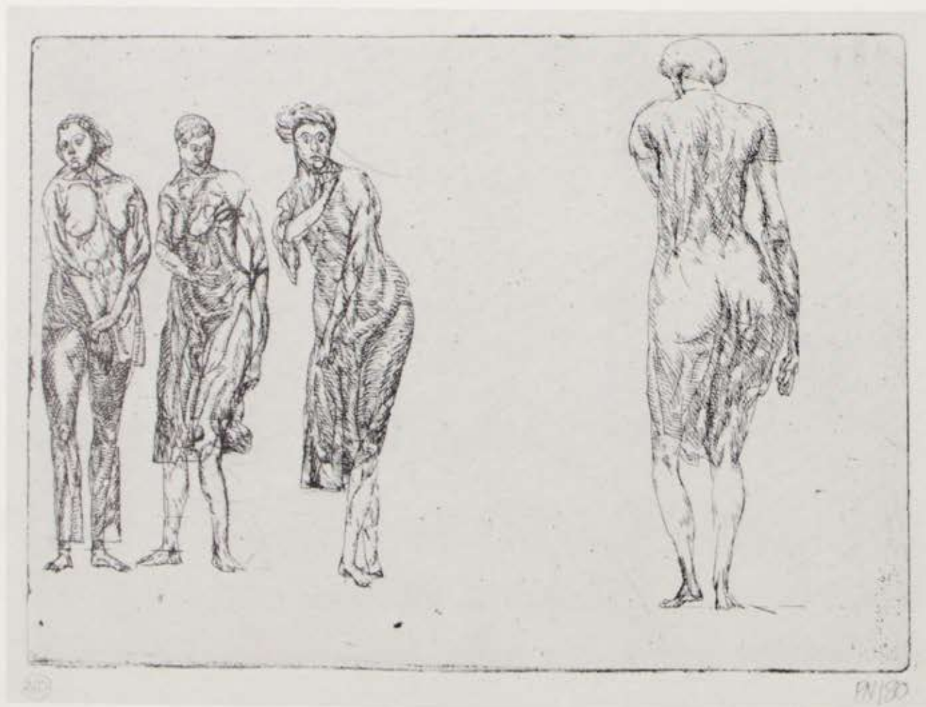
Fra »Lille Radérserie«, (210), radering. 1980. Hel størrelse.

Et håb synes ikke at være ganske ubegrundet, mistroen og væmmelsen stiger, hvalerne rører på sig. Vanviddet bliver klarere og klarere og vanskeligere og vanskeligere at udgive for fornuft.