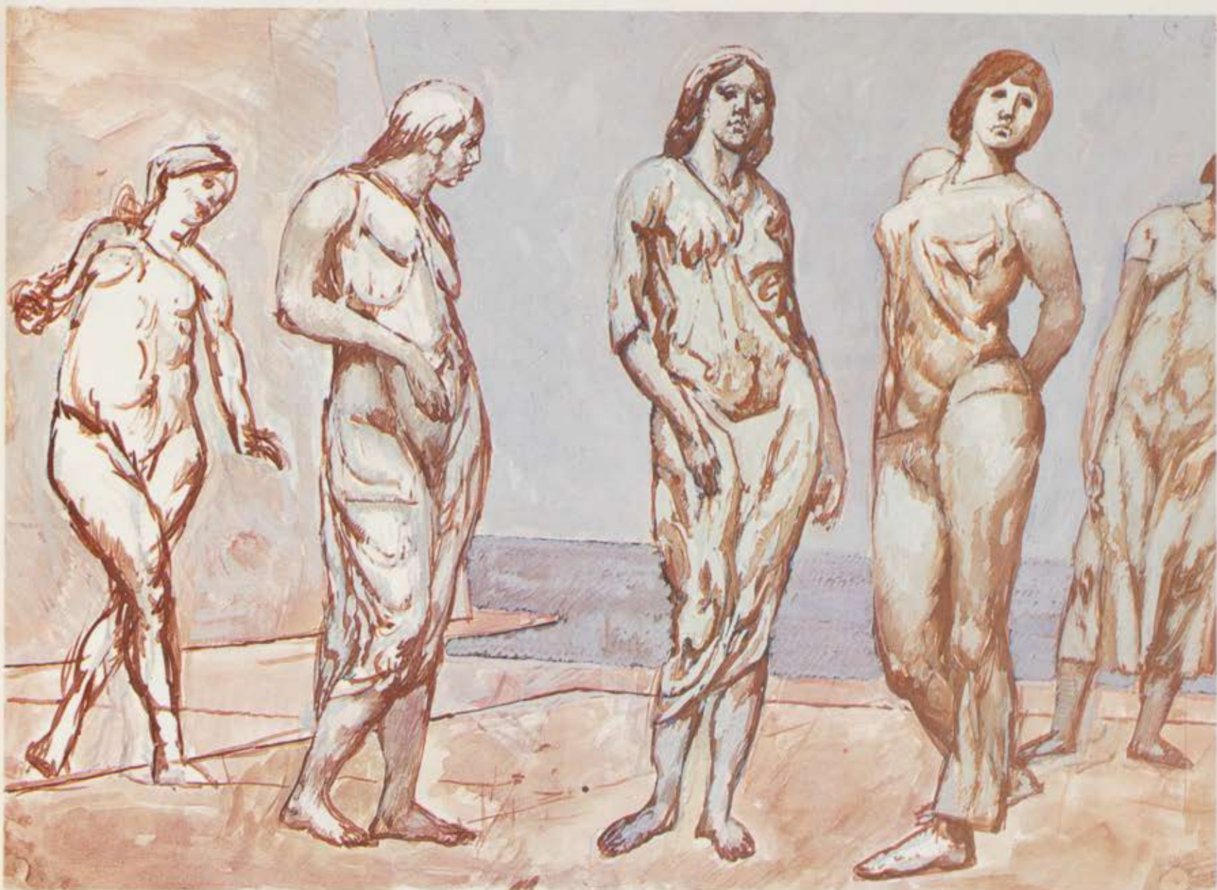
Fra »Lethe«, tempera. 1983. 42,0×59,4 cm.