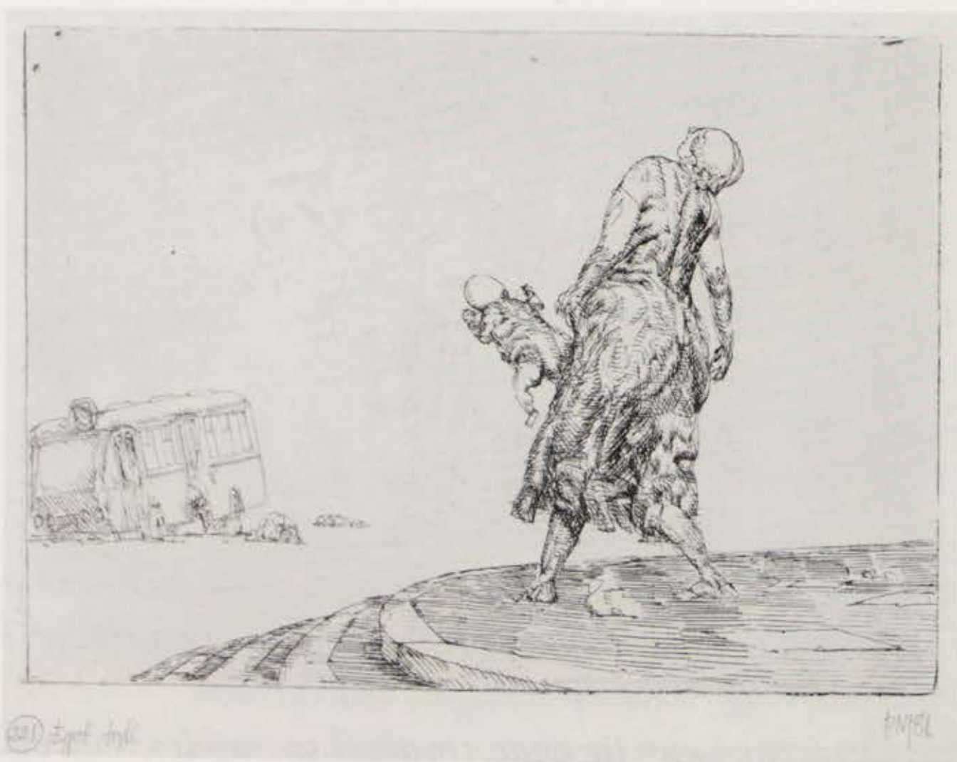
Fra »Lille radérserie«, (221), radering. 1981. Hel størrelse.

For at gøre udsynet større er flere af billederne der gengives her ikke med på udstillingen.