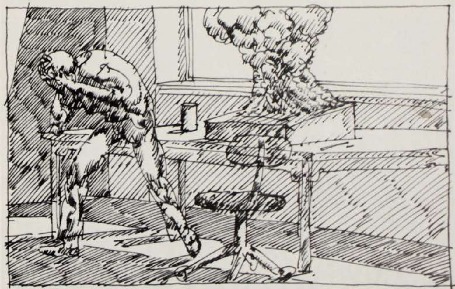
Fra »Narcissus«, (blad nr. 63), pen og blæk. 1981. 9,7 × 14,6 cm.