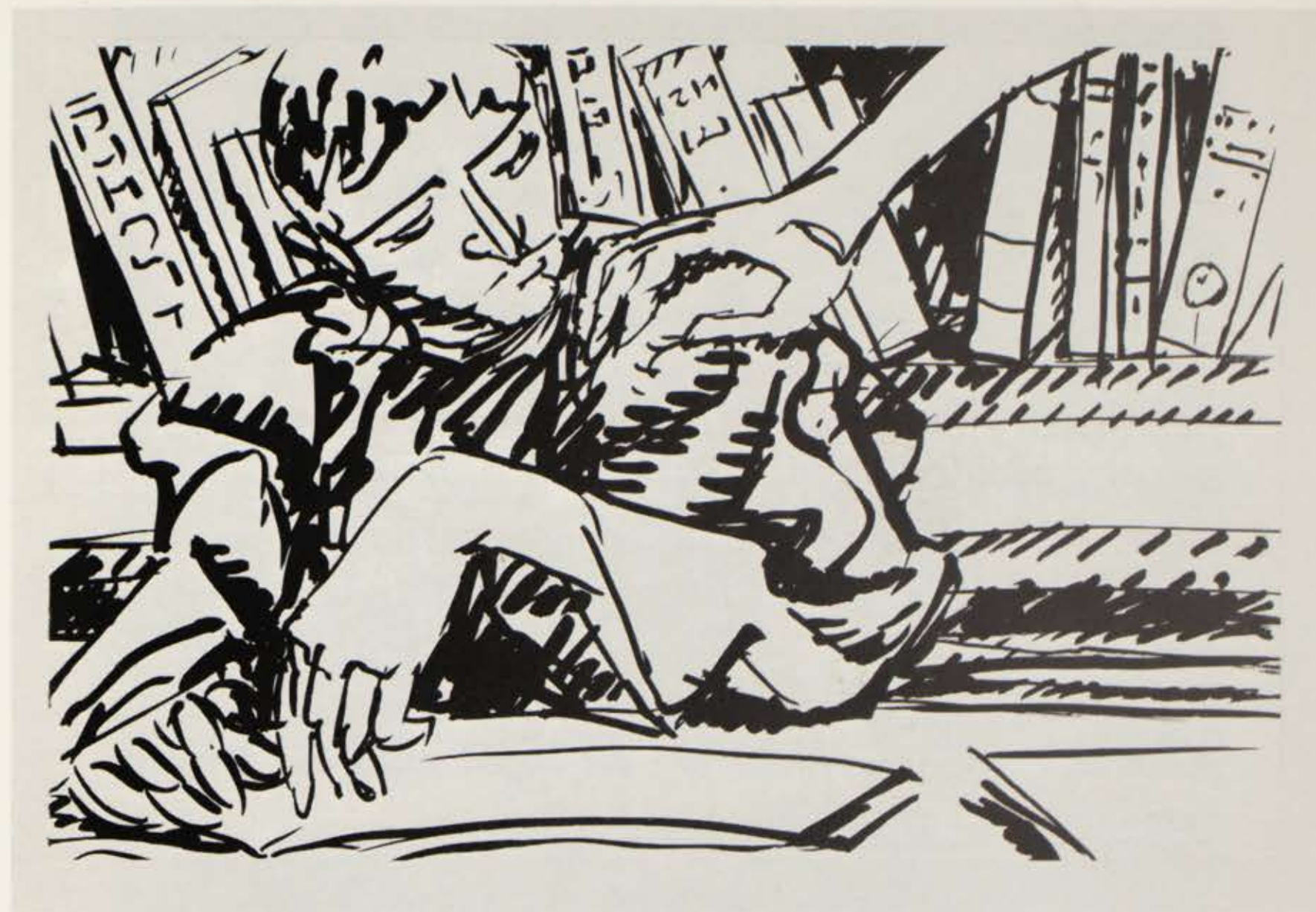
Fra »Katalog«, pensel og tusch. 1977. 23,0×35,0 cm.